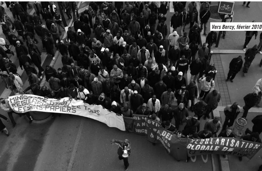
Vers Bercy, février 2010

lui transmettrions, à demander une étude au Conseil des Prélèvements Obligatoires (CPO, associé à la Cour des Comptes) sur l'évaluation des cotisations sociales non versées par les entreprises, et à rendre compte de notre réunion au ministère du Travail.