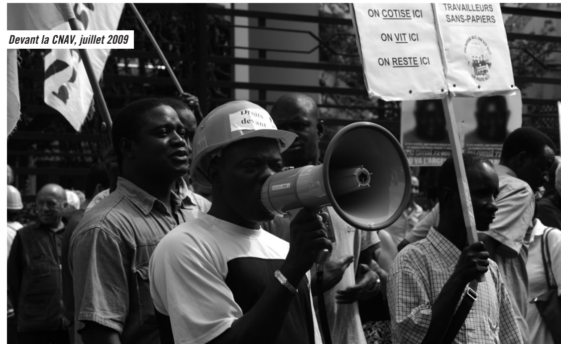
Devant la CNAV, juillet 2009

Dans un premier temps, nous interpellons les consulats de 10 pays : Algérie, Burkina Faso, Cameroun, Congo, Haïti, Madagascar, Mali, Maroc, Mauritanie, Tunisie. Nous les enjoignons à ne plus se rendre complice de ce racket et à ne plus délivrer à la police française les laissez-passer provoquant l'expulsion de leurs compatriotes sans-papiers. La quasi totalité d'entre eux est sensible à nos arguments, et nous constatons une nette diminution des expulsions dès lors que les sans-papiers fournissent au consulat des preuves de travail en France (fiches de paie ou impôts pour les déclarés ; chèques, relevés de compte en banque ou de caisse d'épargne